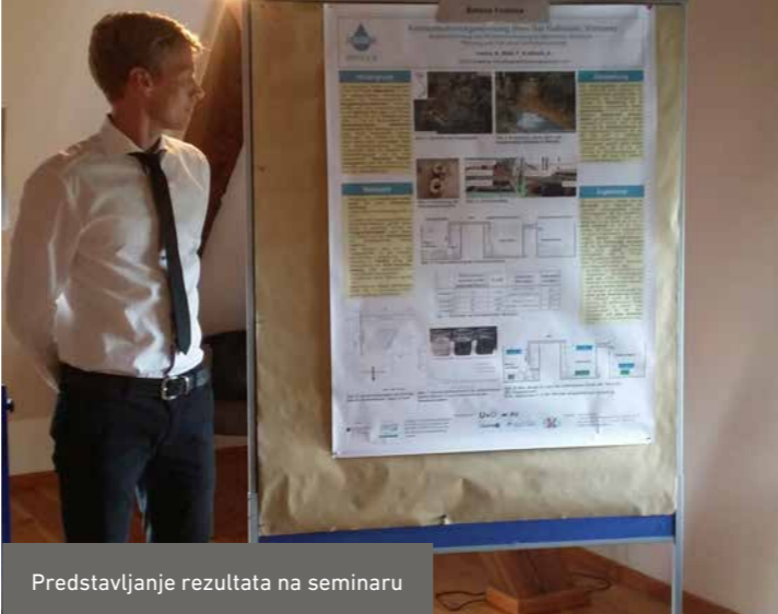
Predstavljanje rezultata na seminaru

Stipendisti se obavezuju da redovno učestvuju na seminarima, podnose izvještaje, ažuriraju svoje podatke i profil na online komunikacijskoj platformi (Stipnet), da unaprijede svoje znanje njemačkog jezika i da blagovremeno prijave eventualne promjene relevantne za finansiranje. Za realizaciju projekta u Njemačkoj nije potrebna radna dozvola. Međutim, za ulazak u Njemačku (duži od 90 dana) potrebna je viza za određene zemlje, u koje spada i Bosna i Hercegovina. Nosioци stipendija blagovremeno dostavljaju svoje prijave za vizu ambasadi Republike Njemačke u matičnim zemljama.