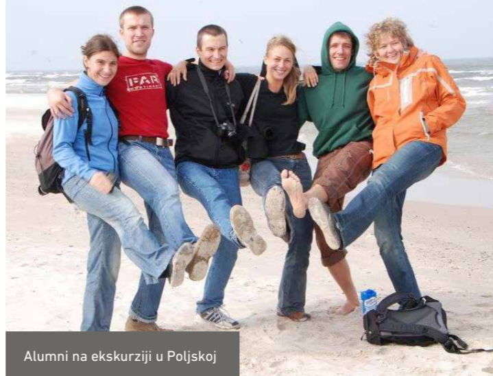
Alumni na ekskurziji u Poljskoj

Svake godine DBU dodjeljuje do 60 stipendija za dalje usavršavanje u svima oblastima okoliša i ekologije u duhu podrške mladim talentima. Stipendije se dodjeljuju kvalifikovanim Master diplomcima iz svih disciplina iz zemalja Centralne i Istočne Evrope. One omogućavaju 6-12-mjesečni boravak u okviru njemačkih institucija: univerziteta, istraživačkih instituta, kompanija, agencija za zaštitu okoliša i ekologiju, nevladinih organizacija, udruženja, itd. U toku trajanja fellowship-a diplomci rade na pronalaženju rešenja za aktuelne okolišne probleme. Nakon boravka u Njemačkoj Alumni su bolje pripremljeni za rješavanje sličnih problema u svojoj zemlji, na ovaj način osiguravajući transfer znanja u matičnu zemlju. Putem međunarodne saradnje se uklanjaju postojeće barijere i uspostavljaju novi kontakti, gradeći snažnu mrežu posvećenih stručnjaka za zaštitu okoliša.