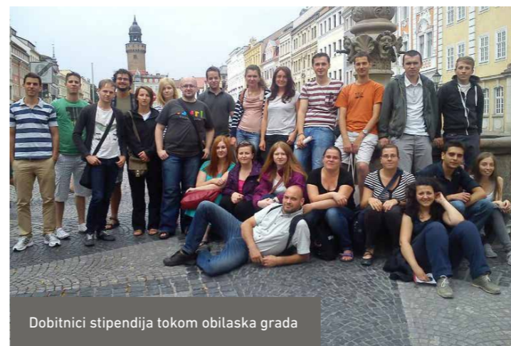
Dobitnici stipendija tokom obilaska grada