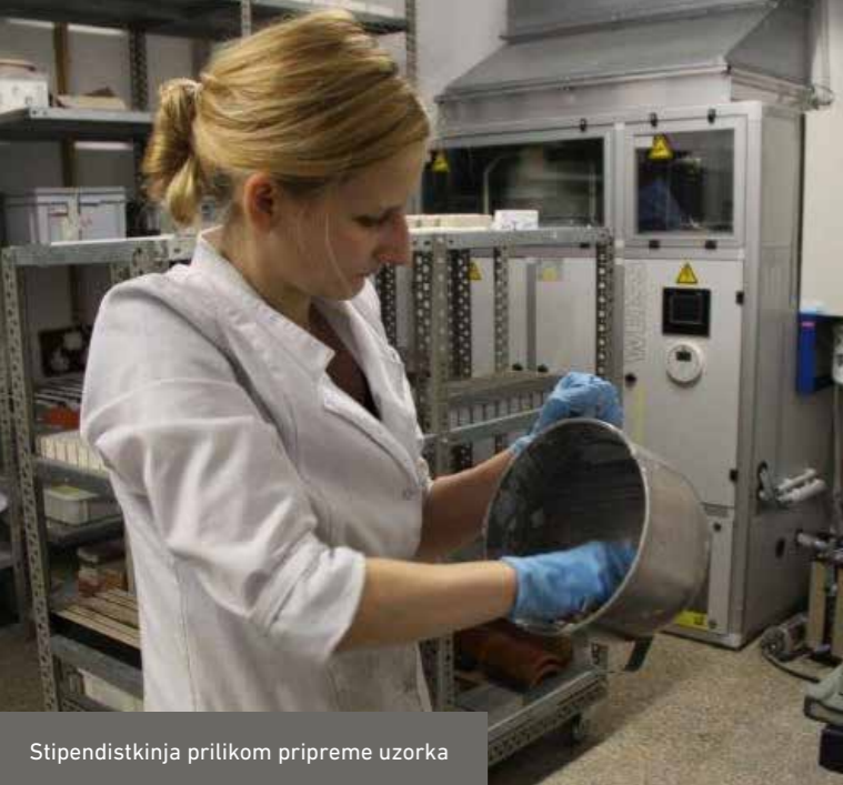
Stipendistkinja prilikom pripreme uzorka