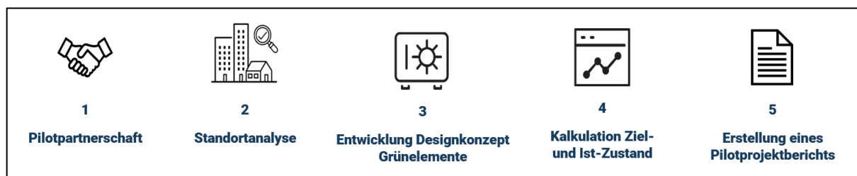
Abbildung 3: Ablauf und Schritte des Pilotprojekts

Nachdem die interessierten Partnerinstitutionen diese Vorprüfung bestanden hatten, begann der allgemeine Pilotprojektprozess, der in den folgenden 5 Schritten dargestellt ist: